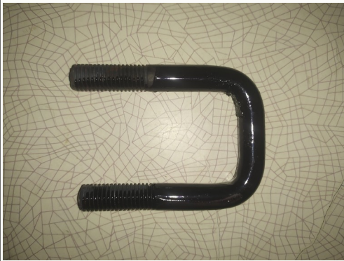
Хомут УКП 2.602