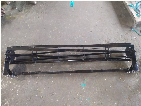
Секция катка планчатого (2м.) СКП 08.00.000