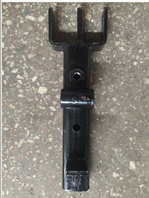
Кронштейн КСОП 12.50.12.000