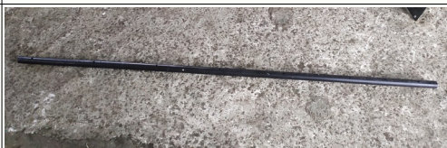
Труба на шлейф комбинированный (2 м.) КСОП 12.80.00.801