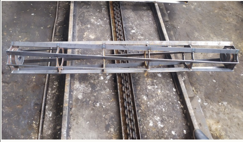
Ротор (2 м.) СКП 10.10.000