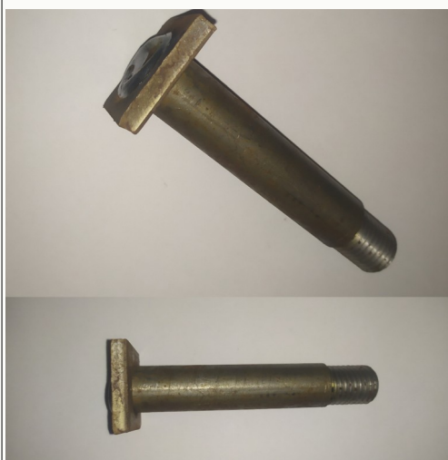
Ось КПП 31.40.000 СБ