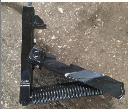
Подвеска рабочего органа КПП 31.00.000