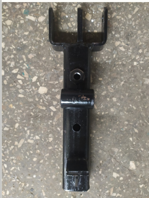
Кронштейн КСОП 12.50.12.000