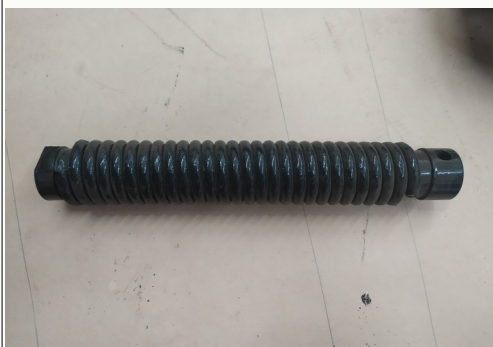
Натяжитель КПП 31.30.000