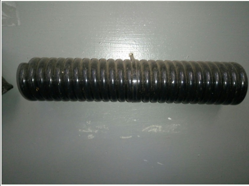
Пружина КСП 00.00.030