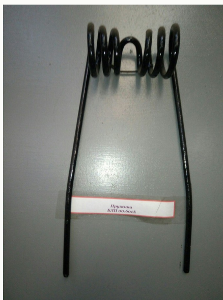
Пружина БЛП 00.601А