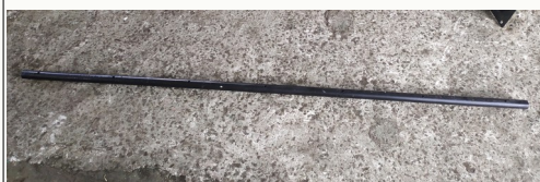
Труба на шлейф комбинированный 2,2 м. КСОП 12.80.00.802А