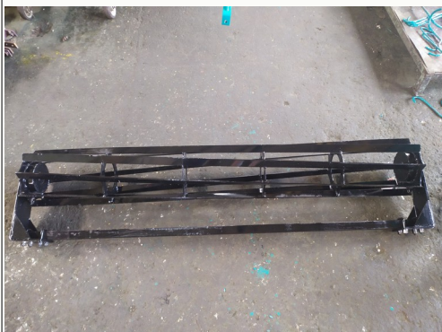
Секция катка планчатого (2,2 м.) СКП 12.00.000