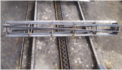
Ротор (2,2 м.) СКП 10.10.000-1